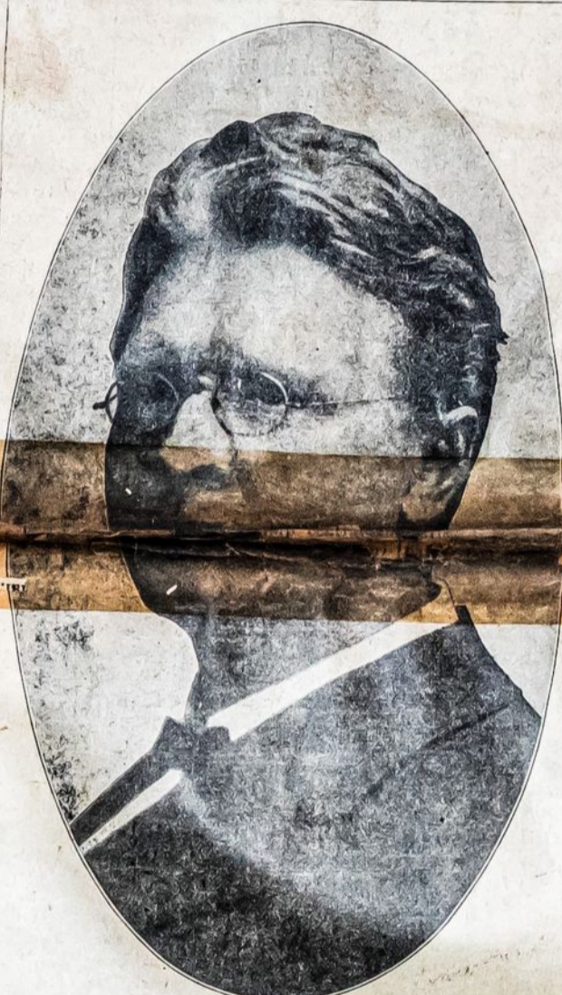
EMIL SEIDEL KANDIDATAS Į VICE-PREZIDENTUS.

Republikonų, demokratų ir «progressistų» partijos veda savo agitaciją už pinigus, suaukautus kapitalistų. Reiškia, tos partijos tarnauja kapitalistams, o ne darbininkams.