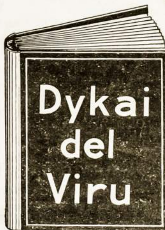
Ta dykai gauta knyga yra vertės $10.00 kožnam sergančiam vyrui.

nas, nevėdes arba apsvėdes, ligotas arba sveikas tur žinoti. Ne naikinkiet sava sunki uždyrbus pinigus, mokedami už nekingas, bevertis vaistus ikikolaik neparskaitistė tą knyga vysai. Knyga ta užėdys jums dang doleriu ir pasakis kaip galete stotis tvirtu ir resnu vyrų. Atmink i tą, jog ta knyga yra siusta jums vysai dykai. Mes užmokam ir už paczta. Nekokie varda medikališka arba daktariška nera ant konverto. Ne vienas nežinos kas tas yra tyk jus. Irašikiet sava varda ir pavardė ir adresa aiškei idėkiet ta dikini kupona ir prisiuskiet mums o gauste tą knyga.