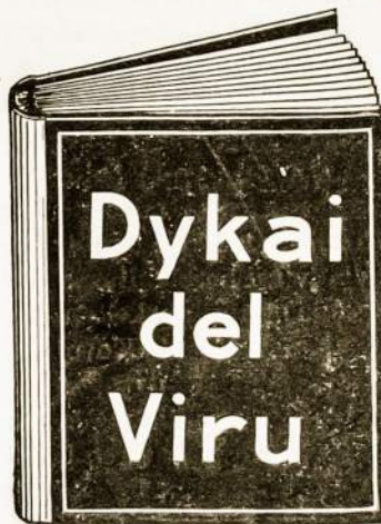
Ta dykai gauta knyga yra vertės $10.00 kožnam sergančiam vyrui.