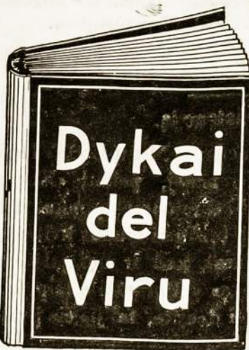
Ta dykai gauta knyga yra vertės $10.00 kožnam sergančiam vyrui.

Ne naikinkiet sava sunkei uždyrbtus piningus, mokedami už nekingas, bevertės vaistus ikikolaik neparskaitistė tą knyga vysai. Knyga ta užėdys jums daug dole- riu ir pasakis kaip galite stotis tvirtu ir resnu vyrų. Atmink į tą, jog ta knyga yra siusta jums vysai dykai. Mes užmokam ir už paezta. Nekokie varda medikaliska arba daktariška nera ant konverto. Ne vienas nežinos kas tas yra tyk jus. Išrašikiet sava varda ir pavarde ir adresa aiskie idėkiet ta dikini kupona ir prisiuskiet mums o gauste tą knyga.