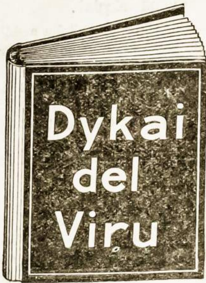
Ta dykai gauta knyga yra vertės $10.00 kožnam serganciam vyru.

nas, nevedes arba apsivedes, ligotas arba sveikas tur žinoti. Ne naikinkiet sava sunkei uždyrbtus pinigus, mokedami už nekingas, bevertės vaistus ikikolaik neparskaitistė tą knyga vysai. Knyga ta užcedys jums daug doleriu ir pasakis kaip galite stotis tvirtu ir resnu vyru. Atmink į tą, jog ta knyga yra siusta jums vysai dykai. Mes užmokam ir už paezta. Nekokie varda medikališka arba daktariška nera ant konverto. Ne vienas nežinos kas tas yra tyk jus. Išrašikiet sava varda ir pavarde ir adresa aiškei idėkiet ta dikini kupona ir prisiuskiet mums o gauste tą knyga.