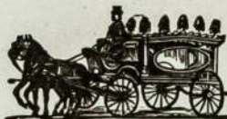
Bell Phone Kensington 57-8

Mono darbas gali but matomas naujoje svetaineje ant E. Allegheny Ave.