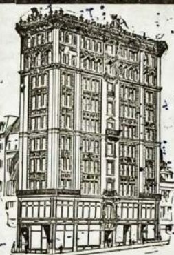
SIEGEL BROS KRAUTUVE.