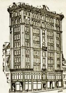
SIEGEL BROS. KRAUTUVĖ.

MES TURIM DIDŽIAUSIA KRUTUVĖ VISOKIŲ AUKSINIŲ, PAAUKSUOTŲ ir SILDABRINIŲ — LAIKRODĖLIŲ, ZIEDŲ, DEVISKĖLIŲ, SPILKŲ IR TEIP TOLIAUS ::