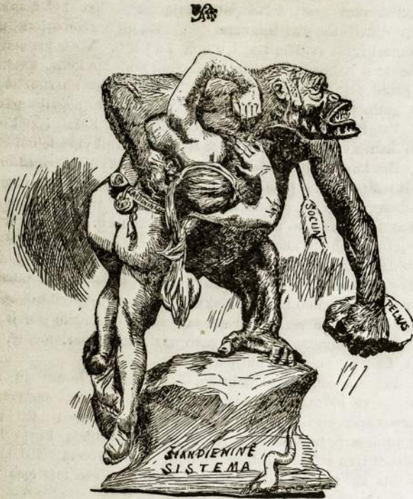
Kapitalizmas ir jo auka — darbininkų klesas.