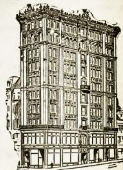
SIEGEL BROS KRAUTUVE.

MES TURIM DIDŽIAUSIA KRAUTUVĖ VISOKIŲ AUKSINIŲ, PAAUKSUOTŲ ir SIDABRINIŲ — LAIKRODĖLIŲ, ZIEDŲ, DEVISKĖLIŲ, SPILKŲ IR TEIP TOLIAUS :: ::