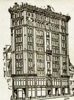
SIEGEL BROS KRAUTUVE.

MES TURIM DIDŽIAUSIA KRAUTUVĖ VISOKIŲ AUKSINIŲ, PAAUKSUOTŲ ir SIDABRINIŲ — LAIKRODĖLIŲ, ZIEDŲ, DEVISKĖLIŲ, SPILKŲ IR TEIP TOLIAUS :: ::