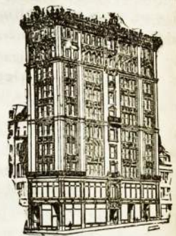
SIEGEL BROS KRAUTUVE

MES TURIM DIDŽIAUSIA KRUTUVĖ VISOKIŲ AUKSINIŲ, PAAUKSUOTŲ ir SIDA BRINIŲ — LAIKRODĖLIŲ, ZIEDŲ, DEVISKĖLIŲ, SPILKŲ IR TEIP TOLIAUS ::