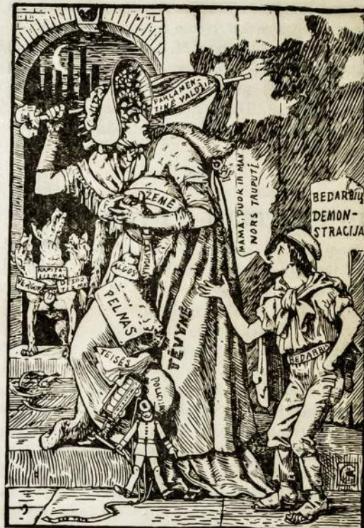
TĖVYNĖ IR JOS SUNUS-DARBININKAI.

(Paveikslėlis paimtas iš atvirų laišku, „Kovas“ redakcijos išlelėtu).