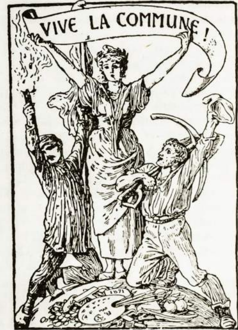
VISOS PASAULĖS DARBININKAI SVEIKINA PARYŽIAUS KOMUNĄ (1871m.)

Būk drąsus ir stok už savo principus. Nė viens bailūnas neuž- sipelnė žmonių pagarbos. Tu niekad nebūsi laisvu, jei pirmiau nebūsi drąsiu. Jei tu nužemintai lenksi galvą prieš tyronybę tų, kuriuos laiko pavergus senovė, tai tu pats esi tos senovės ver- gas. Kokiu būdu tu manai išliuosuot save ir kitus? Kada kiti kovoja pačioj ugnyje to baisaus mūšio, tai tu landžioji paliepėms su socialistišku laikraščiu apatinėj kišenėj, kad kas neužtėmy- tų. Išsitrauk ir skaityk jį drąsiai prieš visą sviatą! Nusikratyk tą kvailą jungą negyvelio. Stok, būk drąsus, ir pasirodyk visam pasauliui, kas tu esi! Savo drąsa idealo apginime, priversk ki- tus guodot savo drąsumą ir principus.