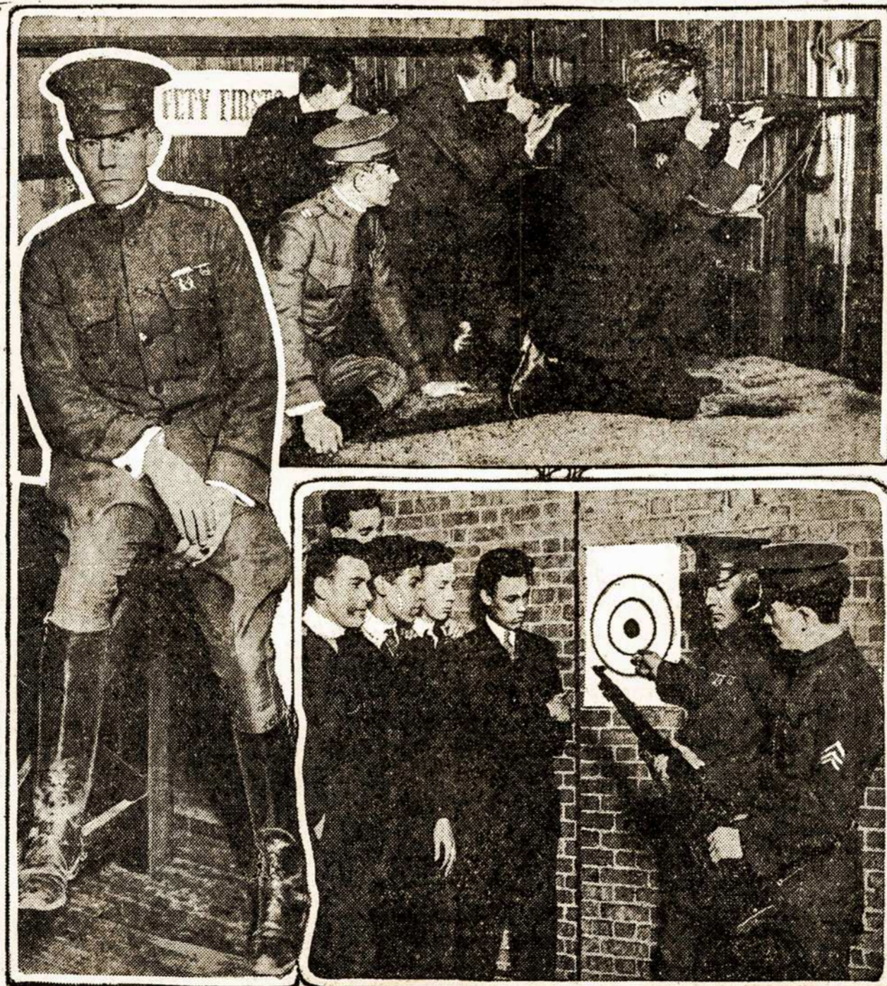
Stuyvesant high school, New Yorke, mokiniai militariniai lavinami. Tos pamokos šaudyme atsibuna kas penktadienis po pietų. Mokina juos S. V. karuomenės kapitonas Rich.

Berlynas, kovo 2. — Kaizeris taikinties su talkininkais nori, bet atsakyti nuo pojurinio karo vedimo nenori. Taip praneša Press Publishing Co. korespondentas.