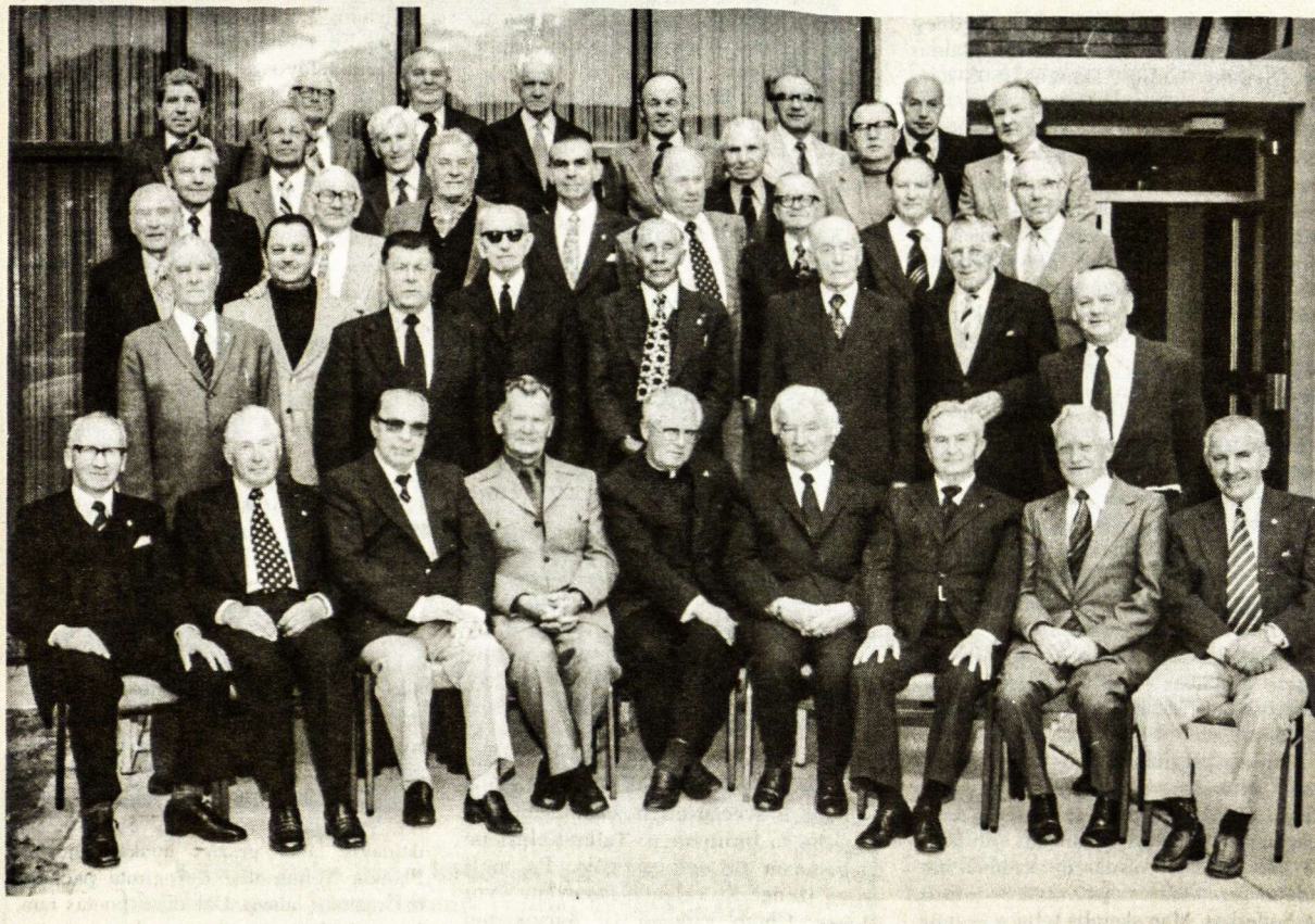
L.K.V. S-gos "Ramovės" Sydney, Australijoje, skyriaus ramovėnai po įvykusio susirinkimo. Priešais sėdi skyriaus valdyba ir revizijos komisija.