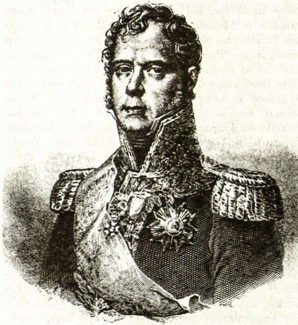
Maršalas Ney (iš Bourriene memuarų III tomo)