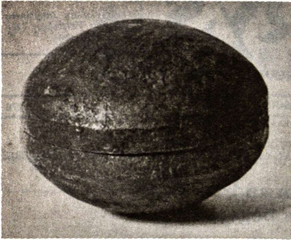
Varinė dėžutė iš Sigtunos

daugiau skandinavų prekybininkų, o kartu ir varingų-plėšeikų, ima Pabaltijį lankyti.