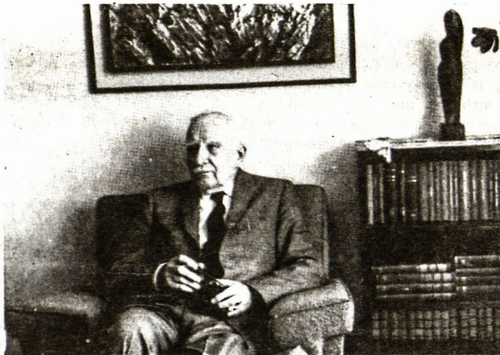
Generolas Stasys Dirmantas, 1969 metais

Todėl, vengdamas kartoti žinomus velionio darbus, norėčiau sustoti tik prie mažiau viešumai žinomų dviejų jo darbų sričių, būtent: 1. prie jo darbų karo mokslo srityje ir 2. kaip jis tyrinėjo senosios Lietuvos karo istorijos šaltinius. Dar prisiminsiu ir jo viešųjų kalbų nekurias mintis.