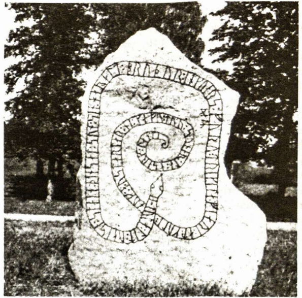
... “Jie pamaitino erelius”. Gripsholmo akmuo.

“Pamaitino erelius”, tai yra, peslius, besimaitinančius lavonais.