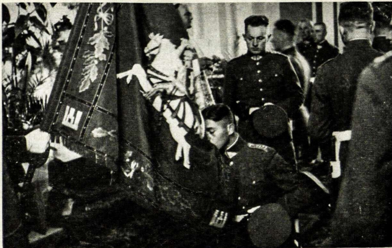
XX kadro karininkų laidos priesaika