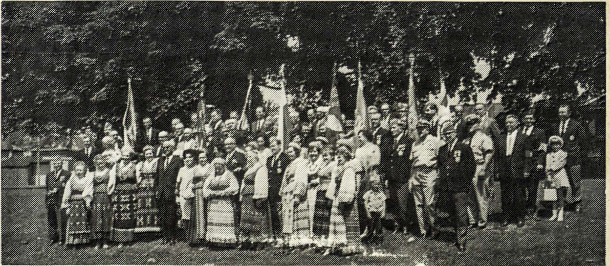
Suvažiavimo dalyviai su kuopų vėliavomis