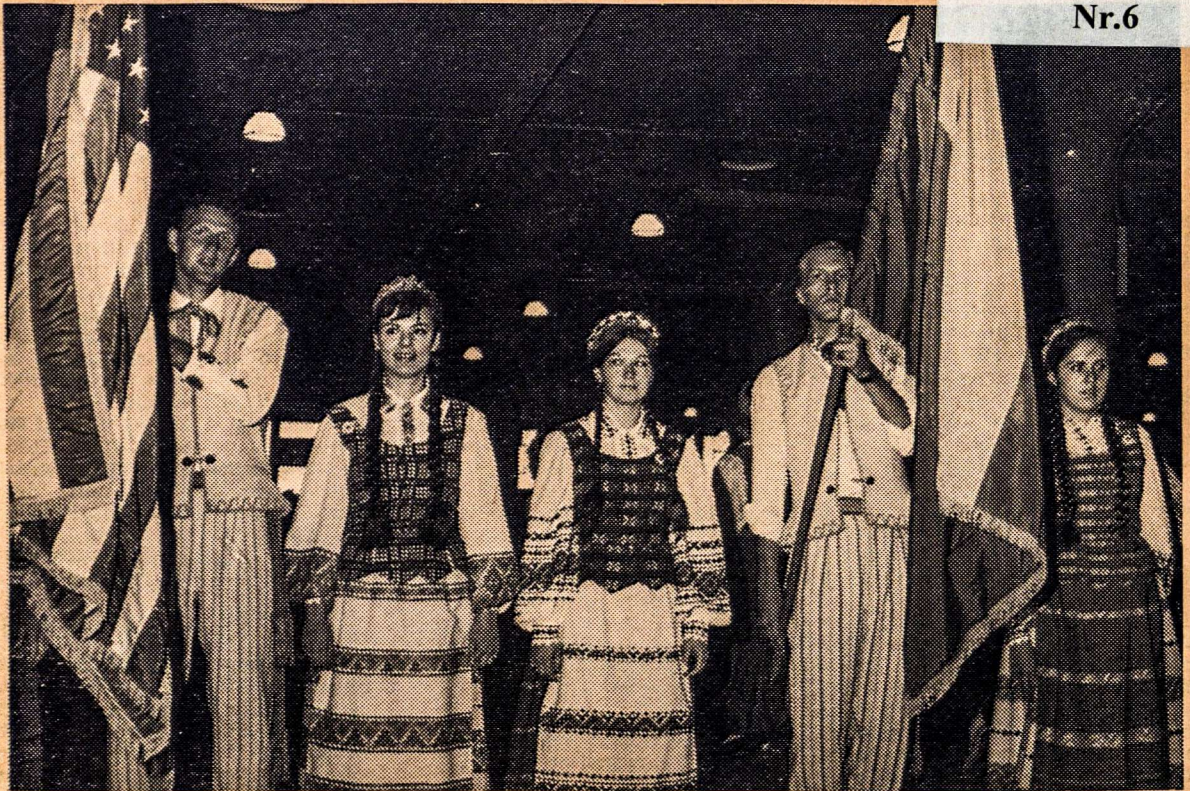
Vėliavos rikiuojasi tautinių šokių šokėjų paradui III Tautinių šokių šventėj, Čikagoje, 1968 m. liepos 7 d.