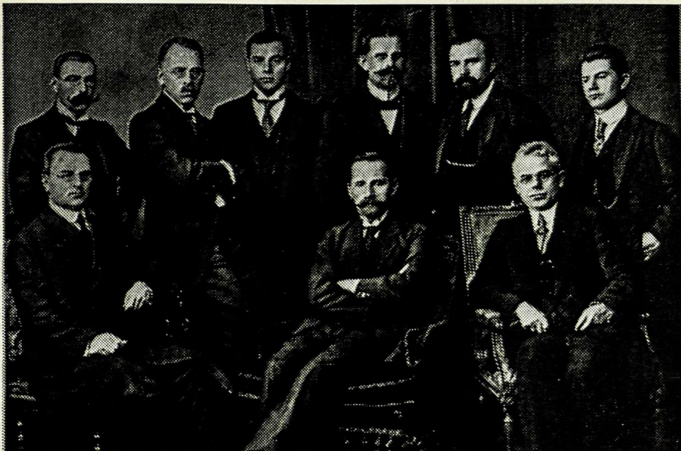
Pasitarimo dalyviai Berlyne 1918 m., kuriame A. Voldemaras buvo numatytas sudaryti pirmąjį nepriklausomos Lietuvos ministrų kabinetą. Sėdi iš kairės į dešinę: kun. J. Staugaitis, A. Smetona, kun. K. Olšauskas; stovi iš k. į d.: J. Šernas, J. Šaulys, J. Purickis, V. Gaigalaitis, M. Yčas ir A. Voldemaras.

pirmais penkeriais valdymo metais karalius gali turėti jų tarpe ir svetimųjų, kurių skaičius betgi neviršija trečdaliao.