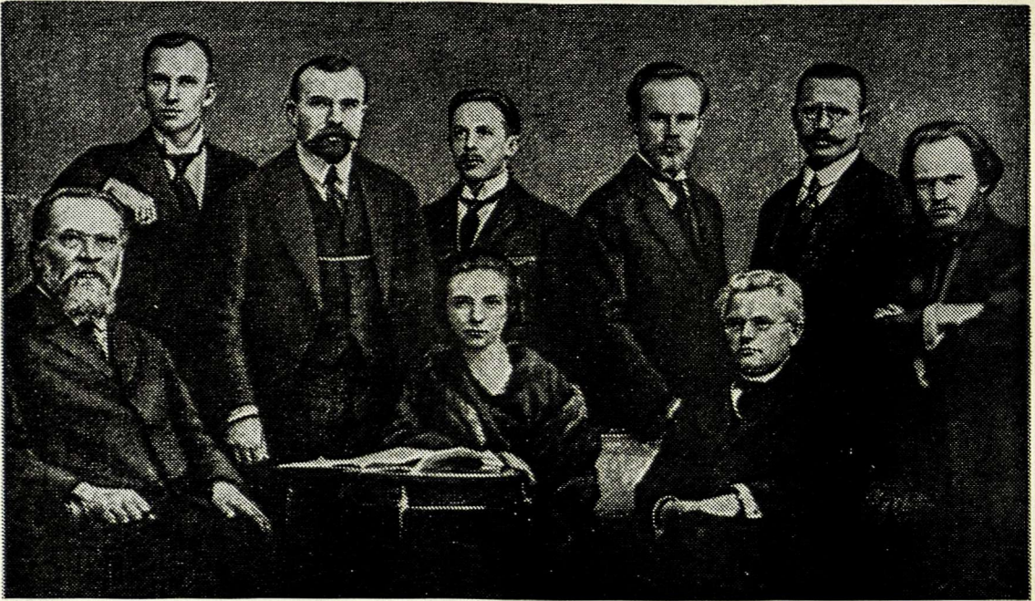
Lietuvių konferencija Stockholme, 1917 m. spalio 18 - 20 d.

mas, geg. 27 d. - birž. 3 d. 1917 m. Petrograde buvęs, kuriame dalyvavo 320 atstovų, rinktų visuotiniu, lygiu, slaptu ir tiesiu balsavimu, tokios pat nepriklausomybės Lietuvai reikalavo; c) kad ir didžiama lietuvių, Jungtinėse Šiaurės Amerikos Valstybėse gyvenančių, per savo seimus ir memorandumais Lietuvos nepriklausomybės reikalavo; d) kad kariaujančios valstybės skelbia tautų paliuosavimo principą, — pareiškiam pasaulio valstybėms šitą Lietuvos Tautos sutartinai reiškiamą valią, jog jau metas atnaujinti Lietuvos valstybę ir primename kariaujančioms valstybėms, jog jau metas proklamuoti Lietuvos nepriklausomybę.