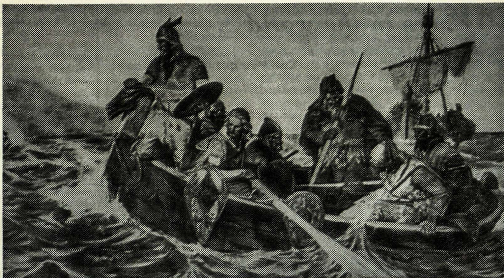
Vikingų žygis jūra