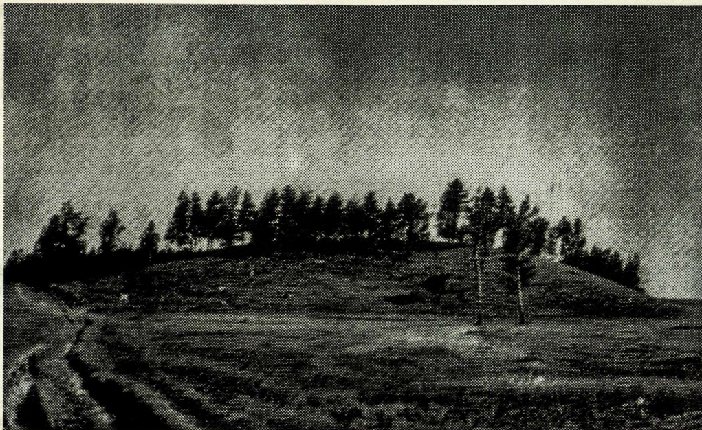
Gražioji Zemaitija: Piliukų piliakalnis Kelmės apylinkėje

plėšikavo ir siautėjo. Krekenavos policija, paštas ir kitos įstaigos jau buvo užsidarę ir jokio patarnavimo nebeatlikinėjo. Pamenu, kaip traukėmės per Pucinėlius, Gudžiūnus ir Grinkiškį, tai nevienoje vietoje matėme gerų lietuvių baimę ir neviltį. Atsiradus prie Šiluvos ir Tytuvėnų, mūsų grupė išaugo iki kokios poros tūkstančių žmonių. Mums žygiuojant organizuotai, pakelėse sutikdavome daug bėglių civilių ir policijos su šeimomis, kurie prašėsi būti priimami į žygio vorą. Taip ir susidarė toks išpūdingas žmonių skaičius, bet kartu ir vargas su judėjimo laisve, nakvynėmis ir maitinimu.