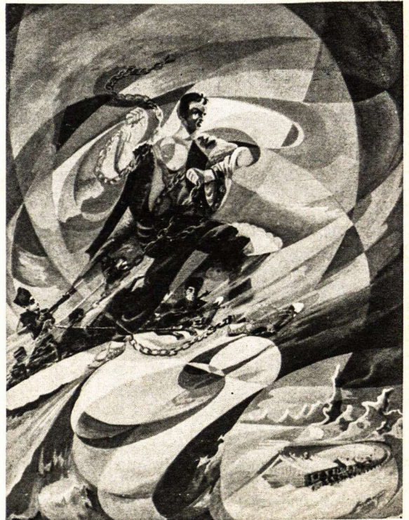
J. Juodis — Broliis Sibire

Nuo tos tragiškos žudynių nakties prabėgo dešimtmečiai, užžėlė kapai, palengva užuomarštin dingsta ir paskutiniai pėdsakai. Tačiau įvykęs faktas, pralietas kraujas — neišdils. Tik dar labiau stiprins mūsų dvasią Lietuvos laisvės kovose.