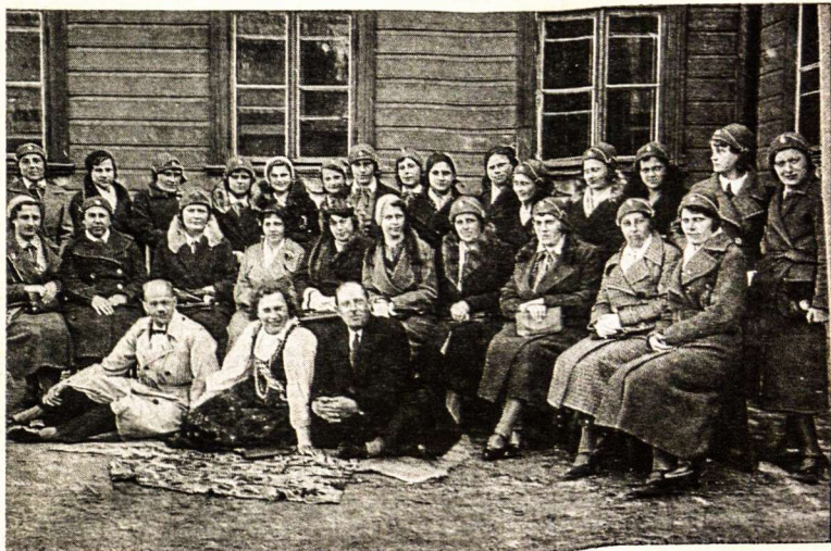
Šaulių moterų suvažiavimas Vilkaviškyje, 1933 m. gegužės mėn. 15 d.