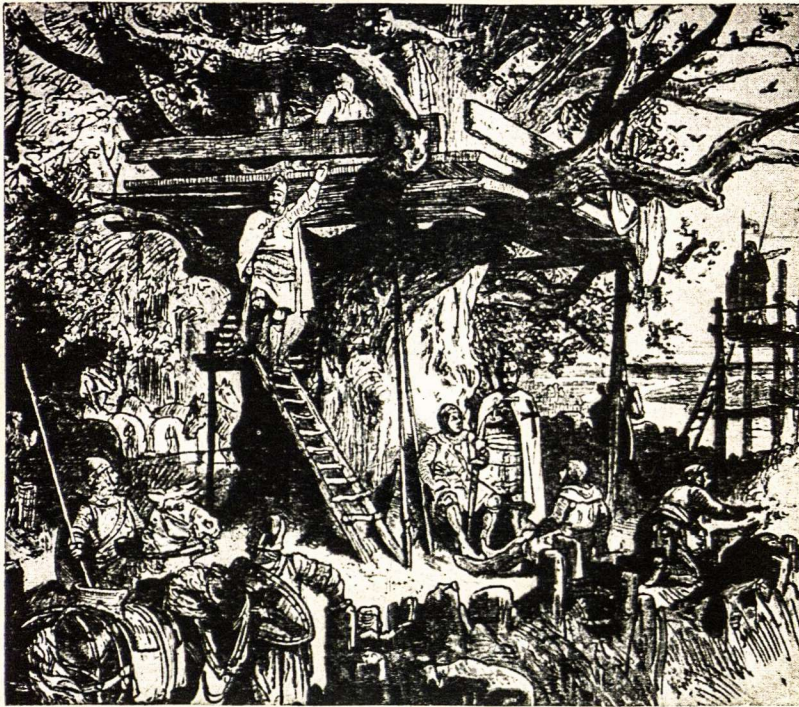
Vokiečių ordono riteriai, 1231 m. pavasarį persikėlę per Vyslą kovai su prūsais, įsirengė tvirtovę šimtametėje ažuole. Vėliau toje vietoje išaugo Torunės miestas.

tė, kad įsijungdami į krikščionių bendruomenę praranda savo laisvę ir patenka vokiečių valdžion, tada, išsižadėję prisiimtojo tikėjimo, pradėjo užpildinėti krikščionis. 1 Dusburgo liudijimu, ir prūsai pradžioje buvę geri ir taikūs žmonės, bet juos suerzino Mozūrų kunigaikščio Konrado grobuoniški troškimai. Tada jie įniršo ir pradėjo siaubti lenkų krikščionių kraštą. 2 Vadinausi, krikščionių neapykantą aiščiuose pačioje misijų pradžioje sukėlė politiniai vokiečių ir lenkų siekimai.