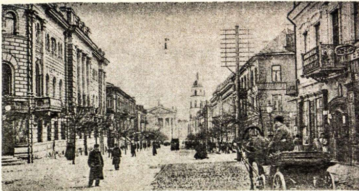
Senajo Vilniaus vaizdai: Gedimino gatvė, buvęs Jurgio prospektas

riktelėjo: "Tai ką, dezertyras!". Kareivis paaikino, jog apie Jašūnus, kur buvo jų mažas dalinėlis, staiga juos puolė didelėmis jėgomis lenkai ir išblaškė. Kovoti buvo neįmanoma. Jam pavyko pasprukti tik numetus karinę aprangą, šautuvą ir civiliniai persirengus.