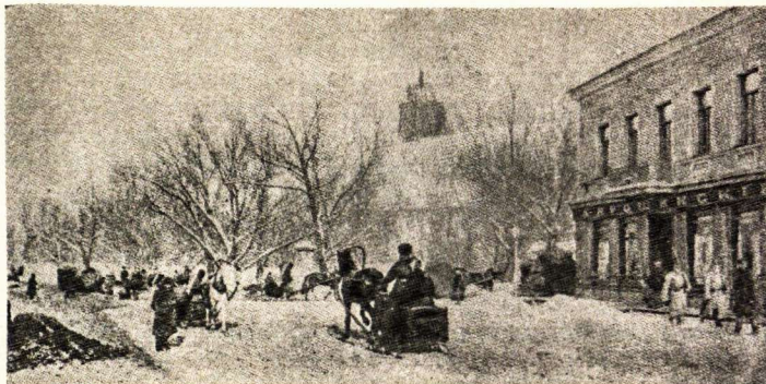
Gedimino pilies papėdėje prieš 60 metų

Stotyje ir apie stotį buvo daug žmonių. Lietuviškai kalbant negirdėjau. Pamatęs nepažįsta-