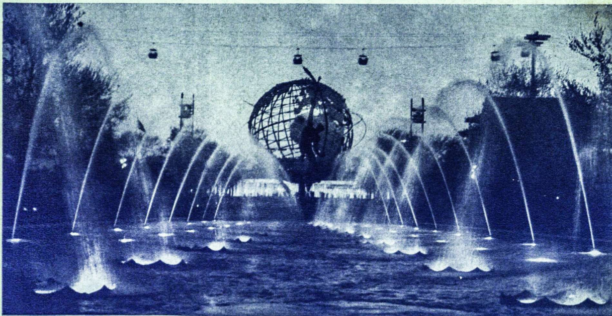
Pasaulinėje parodoje New Yorke

Puikūs ir patogūs kambariai su televizija, radijo ir voniomis, arba atskiri nameliai. Modernus baras, didelis maudymosi baseinas ir ežerėlis, 20 akrų miško, visokiausias sportas vasarą ir žiemą, šokiai ir geras lietuviškas maistas. . . . . Nuolaidos: organizacijoms, stovykloms, suvažiuavimams