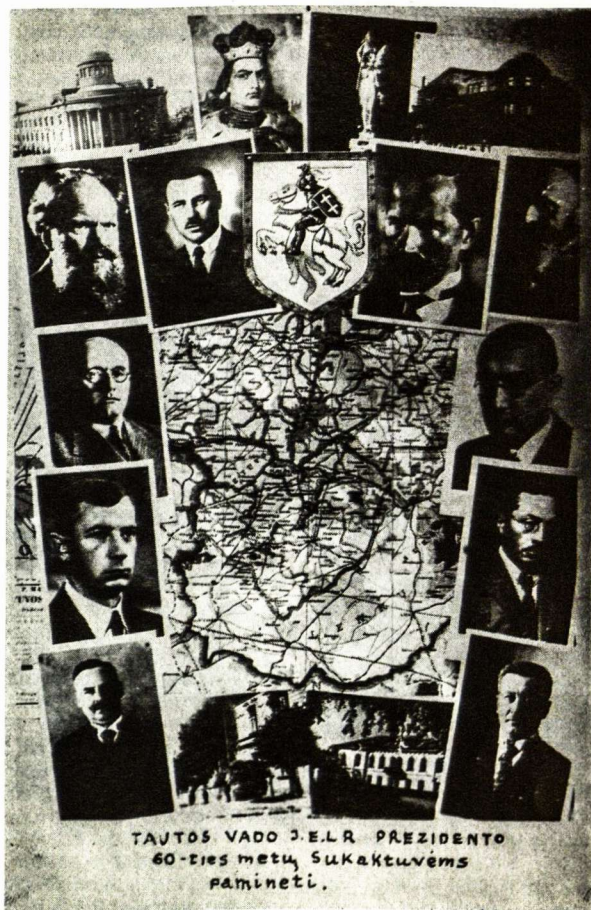
Lietuvos Prezidentas ir 1934 m. ministerių kabinetas