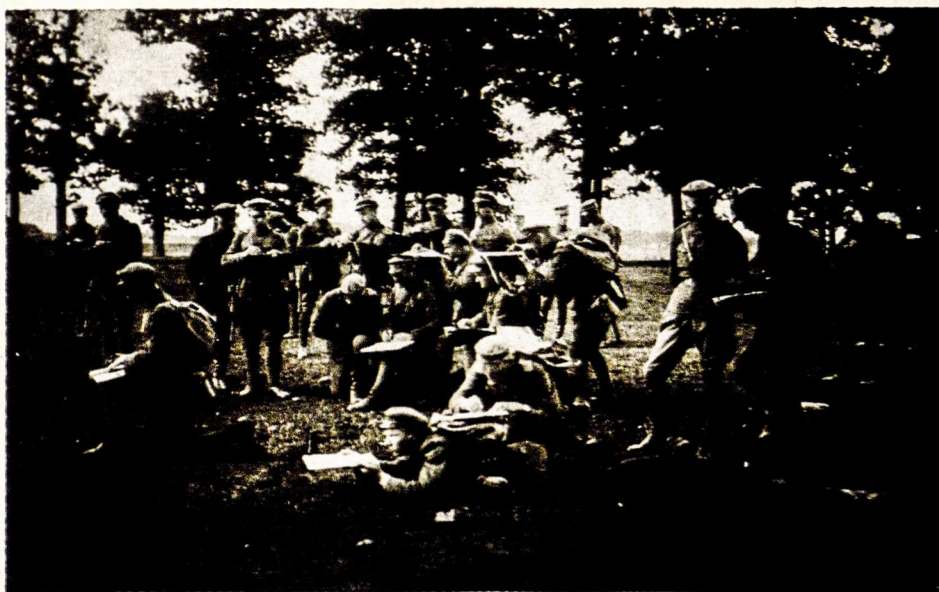
Topografijos pamoka Karo mokykloje

Vokiečių kariuomenei atsitraukiant jau įsibrovė Lietuvos svetimoji (sic.) Rusijos kariuomenė. Ji eina, atimdama iš mūsų gyventojų duoną, gyvulius ir mantą. Jos palydovai — badas, gaisrų pašvaistės, kraujo ir ašarų upeliai.