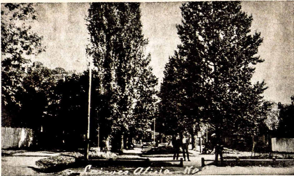
Taip atrodė Laisvės Alėja Kaune 1919 m.