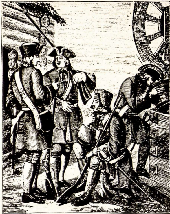
Petro Didžiojo pėstininkai - šauliai

Leidimas buvo jam duotas, ir kovo 25 d. jis atvyko į Radoszkovicze, kur buvo apsistojęs Karolis su štabu.