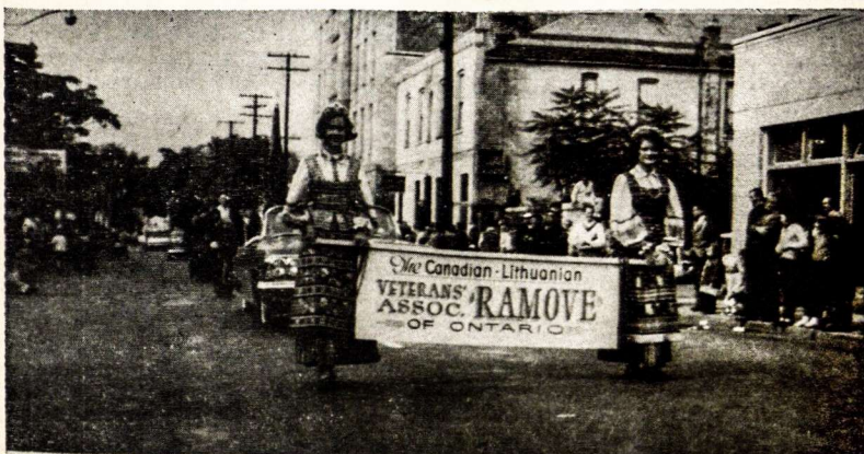
Niagaros pusiasalio ramovėnai parade

tuviams, tuo pagerbdamas kad ir mažą naujųjų kanadiečių lietuvišką grupę.