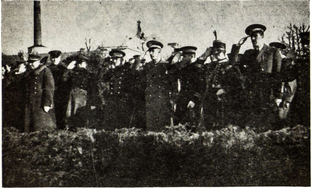
Svetimųjų valstybių kariniai atstovai pagerbia Nežinomo Kareivio paminklą Karo Muzėjaus sodelyje, 1938 m.

santyki su vokiečių reichu, kuris pirmoje eilėje būtų įgyvendintas karo, susisiekimo konvencijos, muitų ir pinigų bendruomenės pavidalu'. Toks nutarimas darosi suprantamas, žinant, jog tada Lietuvoje stovėjo vokiečių kariuomenė.