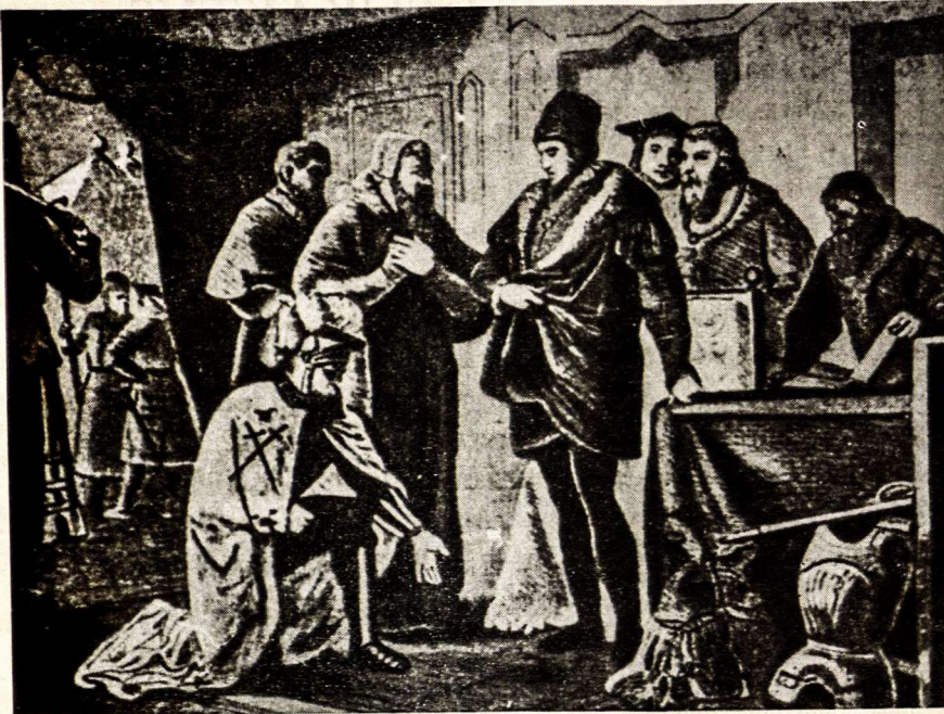
Livonijos Ordino Magistras Fuerstenbergas pasiduoda žygimantui Augustui Pa- svalyje 1557 m.