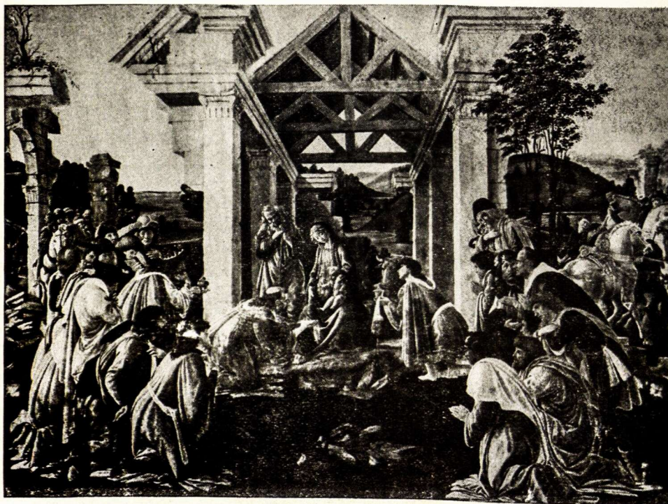
BOTTICELLI: Karaliai sveikina Kūdikėlj