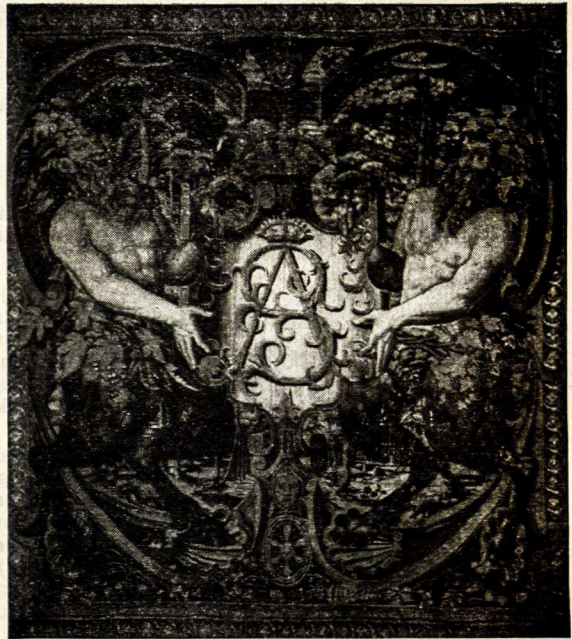
Žygimanto Augusto kilimas—Arrasas; karališkąją emblemą laiko du satyrai. Šeši toki kilimai puošdavo karaliaus palapinę jam keliaujant.

Turint galvoje 16-jo amžiaus sąlygas Lietuvoje — amžinas girias su neišvažiuojamais keliais, pelkėmis, liūnais ir kai kur smėlynais, turint galvoje primityvius kas to laiko susisiektimo priemones, kada be arklio ar jaučio vien savo kojomis tegalima buvo pasitikėti —