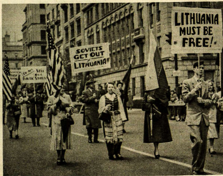
Solidarumo paradas New Yorke 1953 metais. Čia matome lietuvių grupę su dalimi plakatų ir trispalve.

Tai gali būti paneigta, bet JAV Karo Aviacijos vienetai virš Japonijos pastebėjo skraidantį visiškai naują sovietų sprausminį bombonešį JI-28. Atrodo, kad raudonieji bombonešiai tik tada įskrenda į Japonijos teritoriją, kai ten jų radaras nemato amerikiečių patruliuojančių naikintųjų. Ir kai tik JAV naikintojai priartėja prie tos erdvės, IL-28 sprunka į šiaurę.