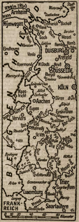
Kovų sėtilas vakaruose tarp Nisderberin ir Saar