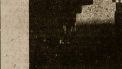
Lietuvos Latvės paminklas Kaune, Karo Muziejus sodelyje.

P. Pomeranijoje, į pietus nuo Prysū ir abipus Arnsvalde, tebevykū kariaus kautynės. Taip pat buvo kietai kovojama Vakaru Prūsijoje prie Graudenz ir Rytprūsiose.