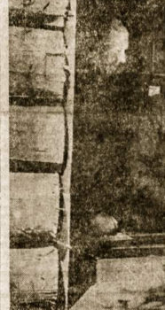
Fiureris savo Vaisiausioje Būstinėje

nebūtų buvęs nuėjutats ir supras tas milijonus porojona, grovėis šė Rytų. Visi gerai pridėmanė, kaip uoliai Maskva grėn pacifista Tautų Sąjungoje ir kaip reklamavosi pasirašydoma nepulimo paketus. Bet ar yra toks, kuris galėtų patvirtinti, kad Maskva po tokio reapiulimo pakto pasirašymo nedavė savo pramonės įskymo žaninti dar didesniais kiekiais ginklus. Maskvos agitatoriai uoliai migde Europos tautų budrumą įvairiomis frazėmis, kad paskui juo lenvėgi ginkluoti patvirtė. Buvo stengėmas kontroliuoti kas kurių valstybių ginkluoties pajėgas ir ginkluoties prietaisus, bet nė vieną kartą Tautų