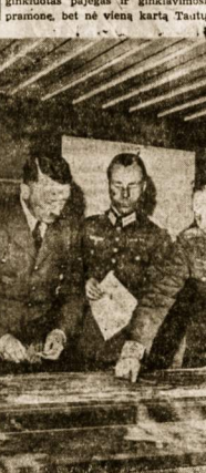
Fiureris savo Vaisiausioje Būstinėje

nebuotų buvęs nuėjutats ir supras tas milijonus porojona, grovėis šė Rytų. Visi gerai pridėmanė, kaip uoliai Maskva grėn pacifista Tautų Sąjungoje ir kaip reklamavosi pasirašydoma nepulimo paketus. Bet ar yra toks, kuris galėtų patvirtinti, kad Maskva po tokio reapiulimo pakto pasirašymo nedavė savo pramonės įskymo žaninti dar didesniais kiekiais ginklus. Maskvos agitatoriai uoliai migde Europos tautų budrumą įvairiomis frazėmis, kad paskui juo lenvėgi ginkluoti patvirtė. Buvo stengėmas kontroliuoti kas kurių valstybių ginkluoties pajėgas ir ginkluoties prietaisus, bet nė vieną kartą Tautų