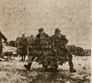
Studentų meno grupė, vadovaujama Jareicko, aplankė batalion.