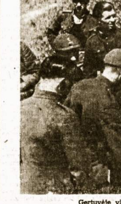
Gerčiuve visados reikia turėti vandens.

SOFIJA. NL. Šekmadėnio vakare per bulgarų radiją buvo pranešta, kad karalius Boris III-jo palikai su karštu nuo pirmadienio iki atėmanėio šekmadėnio, įstojo Bulgarijos kariuomenės odis ir gavo aukščiausią Bulgarijos ordina — Šv. Kl-