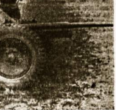
Išbandome naujās gaufas prelatīnīnī publikā, J. psk. Mikāļojno mēst.

Vakarō atsīveikos pamānū apgēdā zemē Penkī karalī tyālīs slenkē gīrovīs esānū prier gēlventojā. Tā eina vīrū, kurīs domos uģydvīnos apsaugot pasīveikīnīs. Ne tollī tīkās.