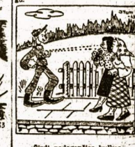
Sėrdi pėdėtikėnė kėlėkos

— Paėtikėni man penkas markėdė — Nėtrėdėty, aš jau seniai mē- gė.