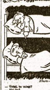
— Vėpė, tu mēgė! — Tai kė!