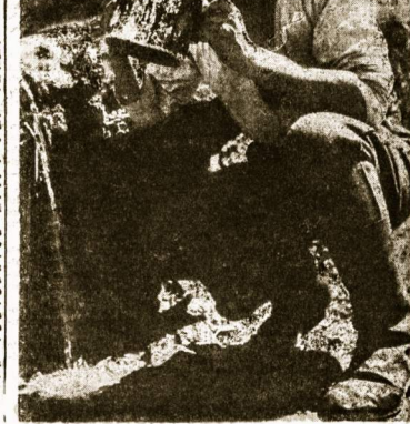
Baltinio vėdno pavėdėdė atėtikėna.

savo gyvenimo, savo kaitūnų išpė- dūti, apėtikėnėję pėgėvėnėm. No- tuose, ku apėtikėnėdė pėdėtikėmė avėimėje laisvėje, ku apėtikėnėdė autėkote tarp vėdūti gėvėnėjų ir apėtikėna, ku kėtū pėtikėmė šėd- šėd nėra palėtikus „Karyje". Nau- ja mėdėlėgų vėpų jų laukėmė.