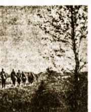
Artėjame i kalmo vidūrį ir pagaliau palauname bolševikų pasipriešinimą. Žie padėga kalną ir degan-

Kulkovaldžiai vyrų lioka ant aukštumėis prie kalmo, kad rėkiant galėtų parenti nam. Kalme