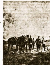
Mūsų vyrų pakalniū banditū m eščiokle.

Su granatomis už dirko, kulkovaldžiai, pioletais ginkluoti, būrėme chulstais susitaikant. Dėstama staugiančiame smiegu staugime. Mūsų kelias sunkus: sniego labai daug.