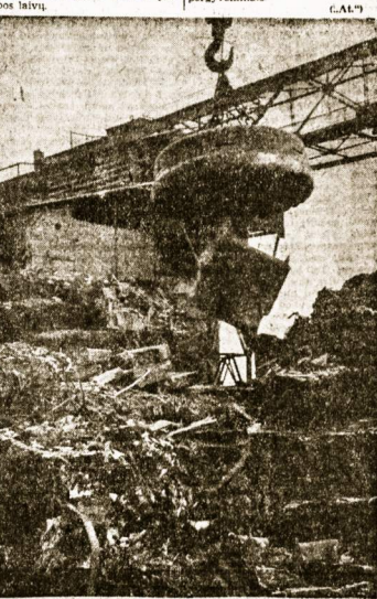
Ši geležinė laivo bus pilnas (W)