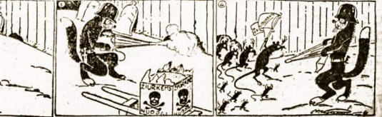
Micės kovą su katurkojais banditais

I tačiūsi langelius įstatyti trūkstausias reides taip, kad guluosė būvėse gautūsi šiu reidimū žodžius: 1. Pasaulio dailis. 2. Javū perdirbimo vieša. 3. Ginklas. 4. Laikotarpis. 5. Beiduro. 6. Spragomūnė reiditija. 7. Nemazs žolėkas. 8. Sprendimus siūsti. 9. Birželio 15 d. J. P. P.