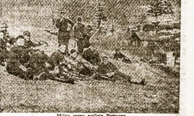
Mūsų vyrų poilsis Rytuose

Gavė dūvėli „Markėdėdantū“ cigāru, cigārečių ir po gerokā poreijū jankėjū, vakarė ausrėmū.