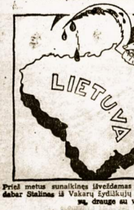
Prieš metus sunaikinus išvėdamus tikėtuzinūs nekaltai lietuvius šėmėmė dabar šitaišius iš Vakarų lydimųjų plėtuokėvių vėl „šaudėroji“ Lietuvai, nes drauge su visi Pabaltijai.