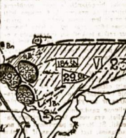
18. 80 išbėgusios grupės ir pastatytos kryptys.

Pagalima, jei būtų ir atstaraždradas vrasas, kuris būtų surtikavęs kelis, šimtus gyvybių, kai iš dalies ir būtų pavykė, nes valgalis ar būtų kas klausio, jeo įsakymai, nes dauguma būtų palaikę provokacija, tuo laiku, kad 1941 m. pavasari buvo platią pasikėdė gandai apie pėnau lietuvių išprovokavimas. Antra, jei būtų ir pavykė suorganizuoti, būtų šis tikrų, kaip buvo mums patirte, patirte ir Rūdininkų mišku, taip pat būtų buvo pavojinga, nes bestraukiantieji boševikų šar-