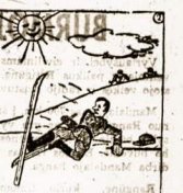
Beje ne taip jau gėda būna nepaėjusiam Paėjusiam...