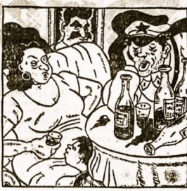
Komandierius su savo „katėlė“ pirmomis dienomis... .. Ir metus Lietuvoje pabuvojus

palydovų dalinys. Ar galima užteigti dėganai sunkvežimii? Kas juose buvo pabėgėti? Trečiojo būrio vadus, kuris buvo artį priėjėš ir girdėto batalio- no vado klausimu, tuoj prane- šė: