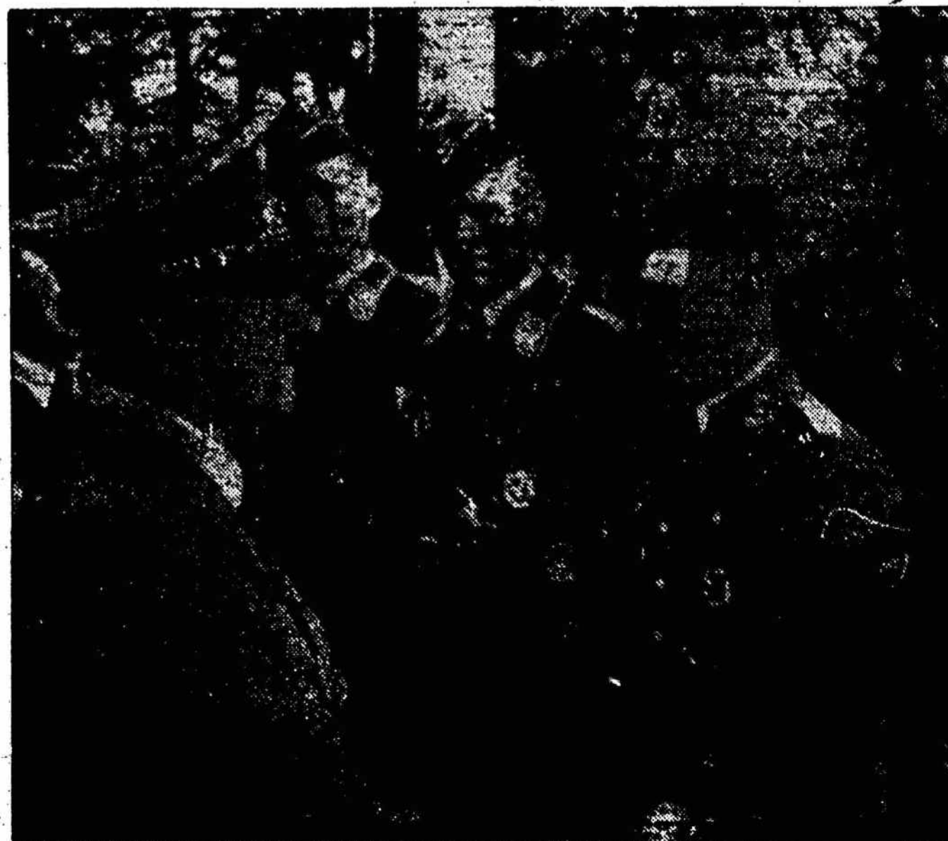
Kancleris Hitleris fronte sveikinasis su kariais

Bergeną IX/23 Elta. Havaso žiniomis, vokiečių povandeninis laivas netoli Bergeno paskandino suomių prekybos