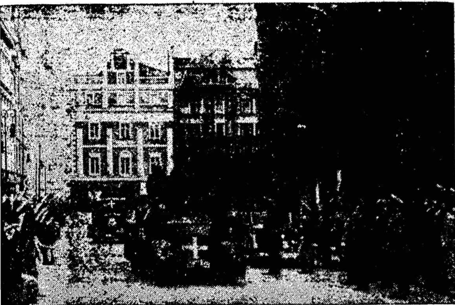
Vokiečių kariuomenė įeina į Poznań

laivą „Martti Ragnar“, 3.8000 tonų talpumo. To laivo įgulai buvo įsakyta susėsti į gelbėjimosi valtį. Pats laivas buvo susprogdintas dinamitu. Dvidešimt penkių žmonių įgula, visą naktį irklavusi, pasiekė Arendalį.