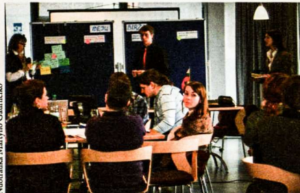
Pristatomi darbo grupių rezultatai

Po pranešimų suvažiavimo dalyviai kelioms valandoms pasiskirsėte į keturias tematiškai skirtingas „idėjų biržas“, kurių tikslas buvo pasidalinti patirtimi, rasti sprendimo būdų rūpiniems klausimams bei išgeneruoti naujų idėjų ir pasiūlymų apylinkių ateities veiklai plėsti ir tobulinti.