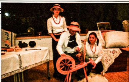
Mokomės verpti vilną kaip mūsų senolės