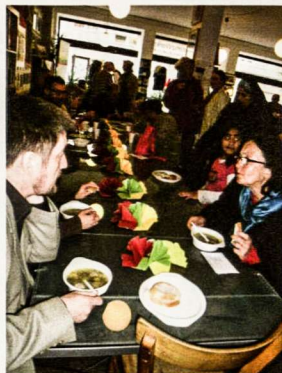
Ragaujame rugštynių sriubą

tas ir St. Wendel neįgalųjų namuose, pagyvenusių žmonių grupėje. Jo metu buvo klausomasi lietuviškos muzikos, demonstruojami video bei leidiniai su Lietuvos vaizdais, vartomas apylinkės nuotraukų albumas bei drauge gaminama šaltiena.