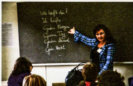
Maziėji Kauno „studentai“ Gimnazijoje mokosi vokiečių kalbos

Spalio 26 - 31 dienomis Vasario 16-osios gimnazijoje vyko kalbų savaitė Kauno technologijos universiteto (KTU) Vaikų universiteto dalyviams.