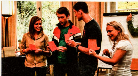
Baltijos šalių atstovai reklamuoja savo išgalvotą produktą – nešiojamą kompiuterį „CrApple“

Nelauždami tradicijų, penktadienio vakarą skyrėme susipažinimui. Susibūrę aplink laužą maloniai bendravome bei klausėmės Annabergo pilies istorijos. Jauki, draugiška atmosfera žadėjo puikų savaitgalį.