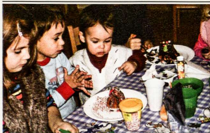
Puošiame ragany namelius

jektus, skatinti grupinio darbo įgūdžius ir organizuoti ekskursijas. Ši Vklą gali būti realizuojama tik tuomet, jei vaikai ir tėvai susidomės ir palaikys mūsų idėjas ir pastangas savo lankomumu.