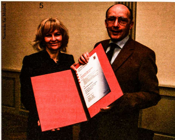
Gabių vaikų ugdymo sertifikatas – ne tik pasididžiavimas, bet ir didelė atsakomybė

Hesseno žemė vadovaujasi integracine gabių vaikų ugdymo politika. Pasak Švietimo ministerijos, dėl gana nedidelio itin gabių vaikų procento kiekvienoje mokykloje, prasmingiau skatinti integracinį, individualiai pritaikytą gabių vaikų ugdymą daugely-