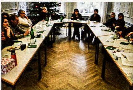
Vokietijoje gyvenantys menininkai dalinasi patirtimi

nininkais? O gal pavadinus save menininku mes tik žaidžiame menu, norėdami būti išskirtiniais?*