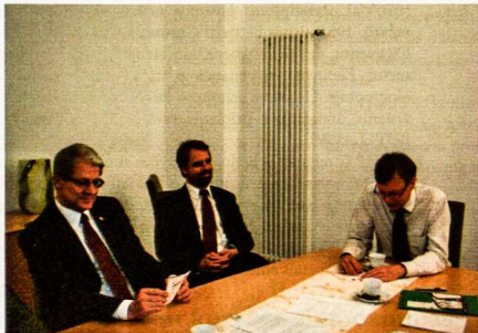
Susitikimas su parlamentarais LR ambasadoje

Nors atgaivinti oficialaus sporto klubo kol kas nepavyksta, berlyniečiai vilties nepraranda. Rugsėjo mėnesį jie gausiai rinkosi stebėti pasaulio krepšinio čempionato varžybų transliacijos Lietuvai – JAV, o spalio pabaigoje išliejo susikaupusią energiją kėglių takelyje.