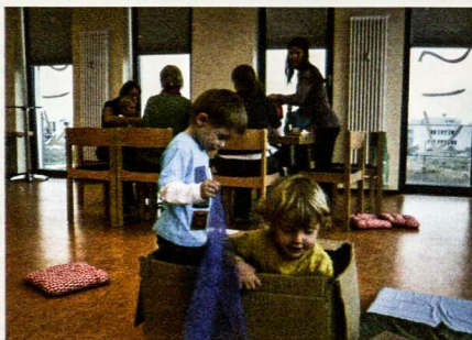
Su kitais lietuviukais – linksma ir smagu!

su metų laikais, aktyviai prapaguoja aplinkosaugą, vaikus skatinami žaisti iš natūralių medžiagų pagamintais žaislais, o drauge pusrūčiodami neapkrauna stalo saldumynais ir vaisvandeniais, bet iš namų atsineša pačių gamintą visaverę maistą. „Mamos-vaiko“ grupės mamos mielai lanko teminius tėvų vakarus, kurių temos yra parenkamos pagal tuomet grupėje esančią poreikį, pvz. „vaikų kalbos raida“, „mažoji užsispjėlio amžius“, „judėjimo svarba vaikams“ arba „sąmoninga ir sveika mityba“. Teminius vakarus veda ir pranešimus skaito įvairūs referantai, kurie remiasi naujausiais moksliniais atradimais.