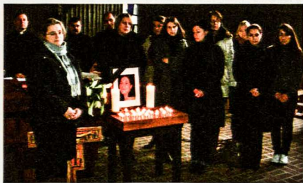
Po gedulingų mišių už mirusią lietuvę, artimiausių draugų rate

Kartu su čia esančiais žuvusios merginos draugais bei nuolat palaikant ryšį su merginos artimaisiais Lietuvoje pagaliau pasiekėme tikslą – šeštadienį, gruodžio 4 dieną, Kólne, kartu su kunigu Vidu