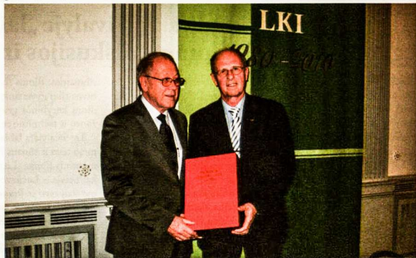
Veringa jubiliejaus dovana LKI – Wolfenbüttele postilės leidimas