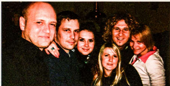
Gardus cepelinai, linksma muzika, puiki nautoika ir geri draugai. Ko reikia daugiau!