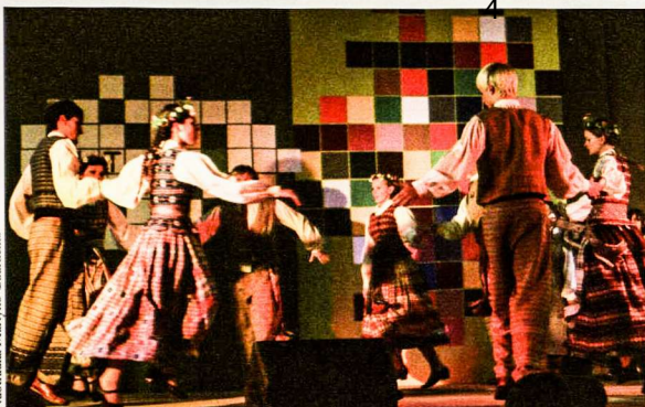
Sventinė Vasario 16-osios gimnazijos mokinių programa