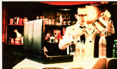
Festivalio žiūrovų geriausiai išrinkto filmo „Pono Vaserio aistra“ ištrauka