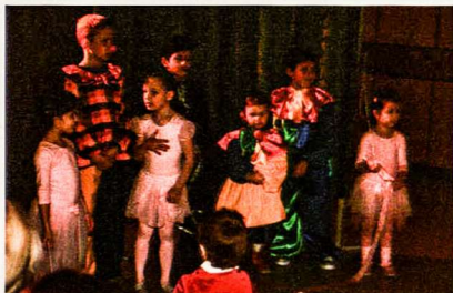
Kalėdų proga – vaikų cirko pasirodymas

bet jam sekėsi ne taip gerai, kaip jaunesiems cirko artistams.