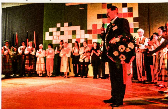
VLB pirmininkas sveikina Gimnazijos mokinius ir dėkoja visiems pagalbininkams