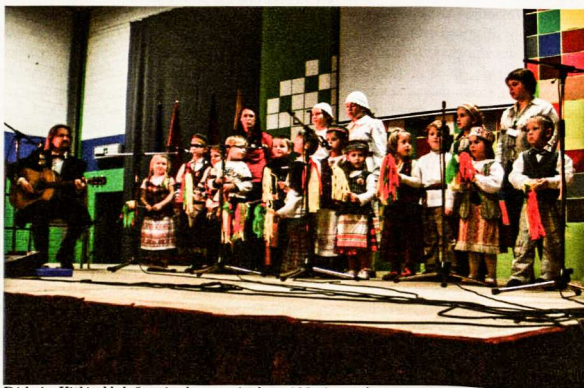
Didysis „Kiškių klubo“ pasirodymas prieš bene 600 žiūrovų!