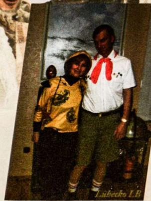
L. Lubeko L.B

Visgi, dėl viso pikto, gražuolė Morė buvo supleskinta."