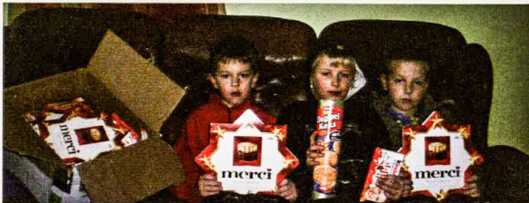
Vaikų namų „Vaiko užuovėja“ auklėtiniai su lauktuveimis iš Vokietijos