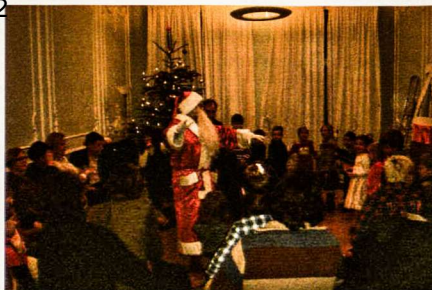
Kalėdų Senelis tikriausiai buvo ne iš Laplandijos, o tiesiai iš Lietuvos!