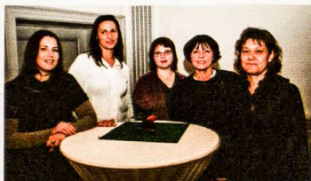
Naujoji Romuvos LB apylinkės Valdyba