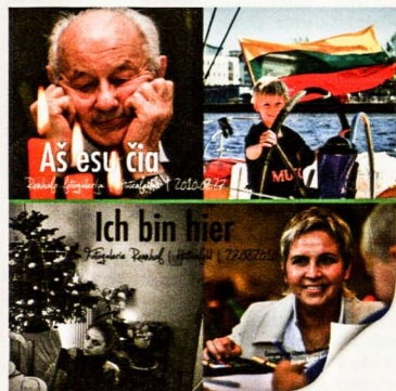
Parodos „Aš esu čia“ katalogas

istorija, jo likimas ir jo egzistencinė aplinka. ELKC direktorius įsitikinęs, jog parodoje kiekvienas lankytojas ras skirtingus atsakymus į su emigracija susijusius klausimus, tačiau „be skaičių ir kreivių, o lemiamą akimirką užfiksuotose žmonių veiduose, kurie dažnai išduoda kur kas daugiau, nei tūkstančiai žodžių“.