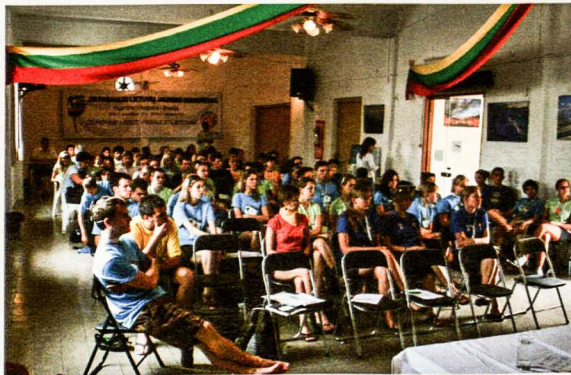
Rimtas darbas nepaisant alinančio karščio – PLJS Kongreso „Studijų dienos“ Urugvajuje

Po intensyvių bei alinančių Studijų dienų kongresantai išvyko į stovyklą „Lituanika“ Brazilijoje. Jaunimas turėjo progą dalyvauti skirtingose sporto varžybose, mokytis šokti garsiąją Brazilijos sambą, išbandyti savo atletikumą su kovos meno