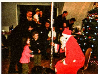
Δ Jaunieji Berlyno liuanistinės mokyklėlės auklėtiniai pasitinka Kalėdų Senelį.