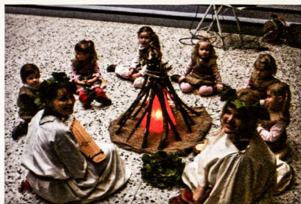
Lietuvos tūkstantmečio minėjimas Hamburge

Šventinį minėjimą atidarė mažieji Hamburgo gyventojai. Pasidabinę lininiais apdarais, susėdę prie laužo bei perduodami vieni kitiems pintą vainikėlį, tyliai dainavo lyrinę dainą. Sukilę, pribėgo prie knygos-metraščio ir garsiai sušuko LITUA – LIETUVA!