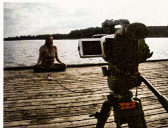
Indiška joga – ant lietuviško tilto