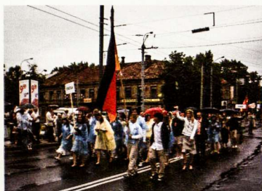
Vokietijos lietuvių atstovai dalyvauja etnyse į Vingio parką

Pagrindinis šventės akcentas visų laukė liepos 6-tą, Mindaugo karūnavimo ir Vals-