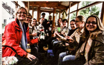
Nuotaikingoji „Leliumai“ iškyla senutėliu tramvajumi