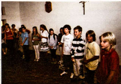
Vyresnieji mokiniai sveikina dar kiek drovius penktokus