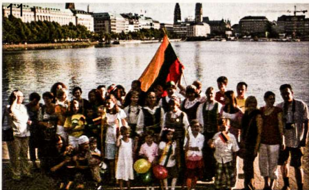
Hamburgo lietuviai gieda Tautiška giesmę