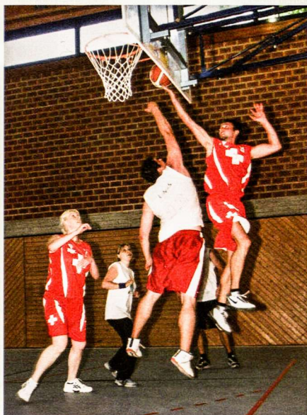
Aistringa kova po krepšiu

Į krepšinio turnyrą Hüttenfelde siemiet buvo atvykę 142 krepšinininkai iš Vokietijos, Anglijos, Švedijos, Danijos, Baltarusijos, Šveicarijos ir Lietuvos, o per vieną dieną buvo sužaistos net 37 rungtynės. ELKT staigmena tapo turnyro naujokai Šveicarijos lietuviai, atsivežę šaunų būrį sirgalių ir sugebėję prasibrauti net iki pusfinalio. Didelių komplimentų nusipelnė ir Frankfurto lietuviai, atvykę į turnyrą tik penkiese ir sužaidę net 6 rungtynes be keitimų. Šauniai pasirodė ir gausi jungtinė Korno-Bonnos komanda, taip pat atvykusi į turnyrą pirmą kartą. Linksmiausia komanda buvo pripažinta publikos numylėtiniai Vokietijos „Oplia“ ekipa, atvykusi