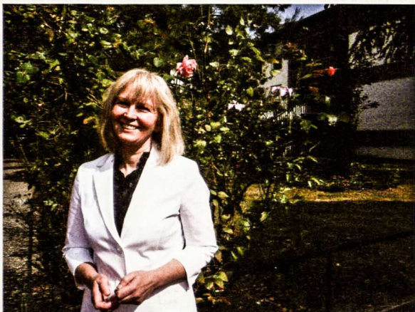
Naujoji gimnazijos direktorė – nuoširdi, entuziastinga, veikli