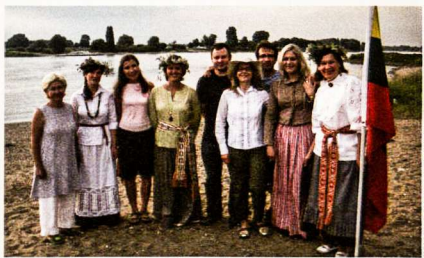
Pasaulio lietuvių giedama Tautiška giesmė skambėjo ir prie Reino