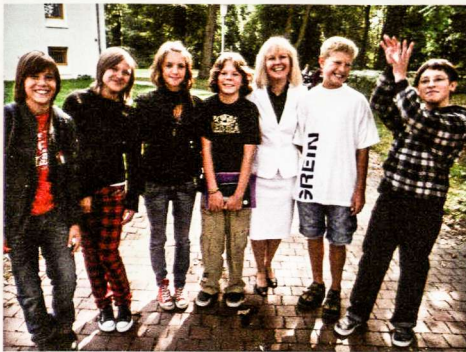
Neuaplepiamas vaikiškas džiaugsmas...