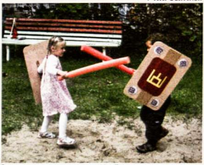
Grumtinių inscenizacija Liepos 6-osios proga