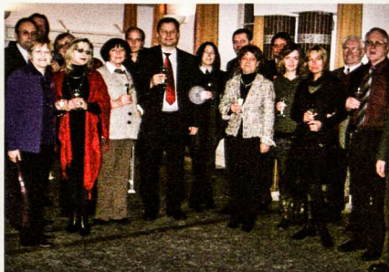
Vokietijos lietuviai su ambasadoriumi E. Ignatavičiumi