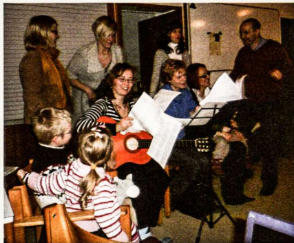
Nuotaikingoji dainų popietė