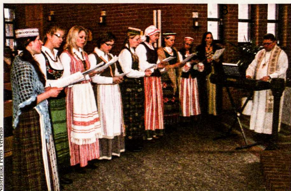
Lietuviškose mišiose dainuoja ansamblis „Leliukai“

kojo didis Lietuvos visuomenės veikėjas, meno, muzikos, kultūros istorikas, publicistas ir lemiamu šaliai periodu buvęs Lietuvos vadovas prof. Vytautas Landsbergis.