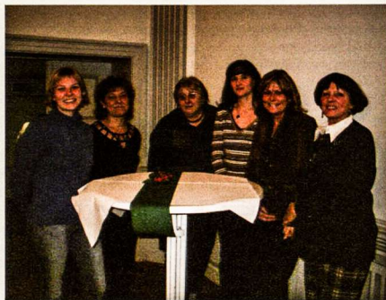
LB Romuvos apylinkės valdybos sudėtis šiais metais nepakito