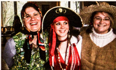
Išradingosios Köln-Bonnos lietuvičių Užgavėnių kaukės