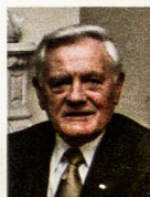
Lietuvos Respublikos Prezidentas Valdas Adamkus

Būkime kartu su Lietuva ir pasauliu! Vienu balsu garsiai skelbkime: Lietuvai jau tūkstantis metų!