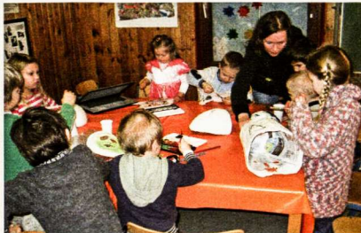
Mokyklėlėje verda darbas