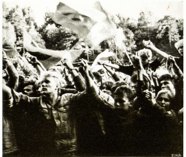
Roko maršas per Lietuvą, Vilnius 1989 08 08

Sąjūdžio 20-metis yra lemtingas dar dėl vienos aplinkybės. Vasario 16-osios Lietuvai, kėlusiai vėliau Sąjūdžiui artimus idealus, buvo skirta gyvuoti beveik tiek pat metų. Todėl prasminga palyginti dabarties jautrumą su tomis nuotakomis, kuriomis gyveno trisdešimtųjų pabaigos Lietuva. Vasario 16-osios valstybę sukūrusi visuomenė ir kai kurie jos lyderiai irgi jautė, kad nyksta buvę liberaliosios demokratijos lūkesčiai, todėl buvo nepatenkinti valdžios politika. Žemaitė, Vaižgantas, jau nekalbant apie kairiuosius ir net krikščioniškosios de-