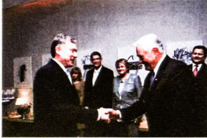
Prezidentai H. Köhleris ir V. Adamkus

2008 m. kovo 15 d. Lietuvos Respublikos Prezidentas Valdas Adamkus kartu su Vokietijos Federacinės Respublikos Prezidentu Horstu Köhleriu, Latvijos Respublikos Prezidentu Valdžiu Zatleru ir Estijos Respublikos Parlamento Pirmininke Ene Ergma dalyvavo Baltijos kultūros metų „Essentia Baltica“ oficialiame atidaryme, vykusiame Berlyno filharmonijoje.