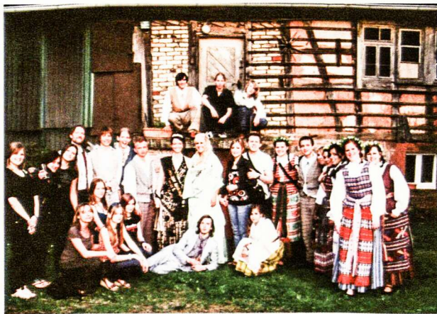
Vasario 16-osios gimnazijos mokiniai Grasellenbache