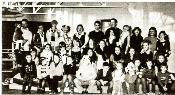
Vaidintojai su Kiškių klubo nariais