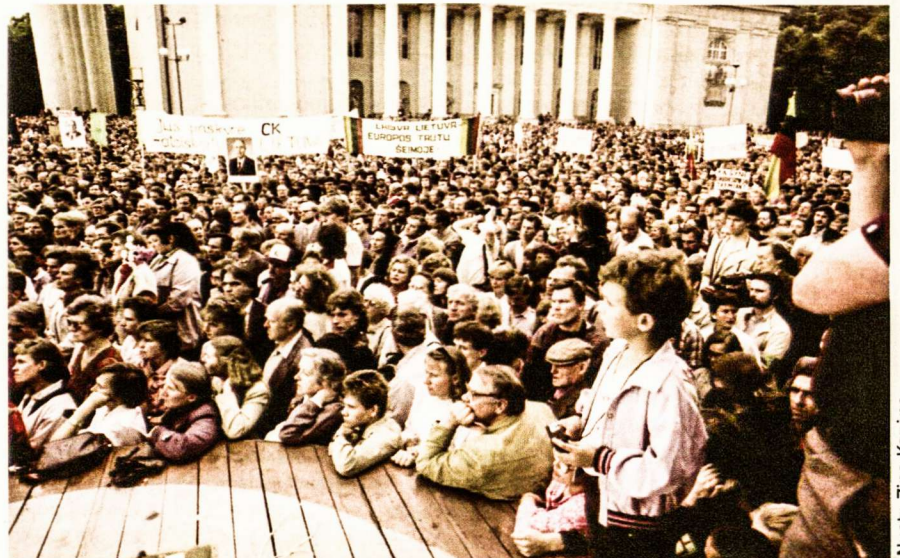
Sąjūdžio mitingas Katedros aikštėje 1988 06 24

Kalbu apie dvidešimties metų senumo realybę, o mintyse, atrodo, jaučiu labai artimą paralelę su šiandienine Lietuva. Nemažai mūsų žmonių jaučiasi nusivylę, nereikalingi, praradę moralinį ryšį su savo valstybe, neretai – ir ekonomiškai sužlugdyti. Tokioje situacijoje atsidūrę piliečiai šiandien klausia: koks mūsų, laisvės vaikų, santykis su dainuojančios revoliucijos įvykiais, su aukomis, kurias sudėjo tėvų ir senelių karta? Ar jauniems žmonėms ką nors reiškia vienybė ir emocinis susitelkimas, jaudinantis Baltijos kelyje stovėjusių žmonių solidarumo ir patriotizmo jausmas? Kur prieš dvidešimt metų Sąjūdžio žadėta dora, pažanga, gerovė? Ar dar įmanomas žmonių moralinis atgimimas, solidarumas ar bent susikalbėjimas, kuris mus visus telkė Sąjūdžio metais?