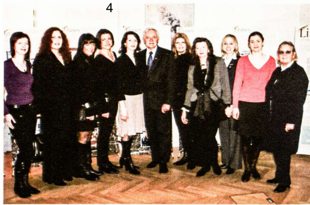
LR Prezidentas su Hamburgo apylinkės narėmis

Prieš tai vykusiame Lietuvos, Latvijos, Vokietijos Prezidentų bei Estijos Parlamento Pirmininkės susitikime buvo kal-