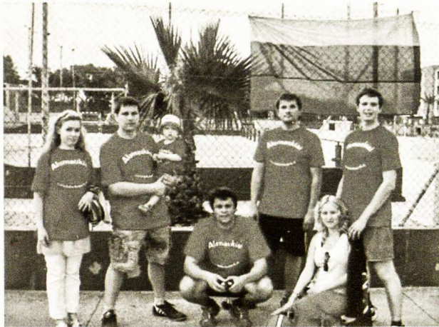
„Alumaukiai“ krepšinio komanda