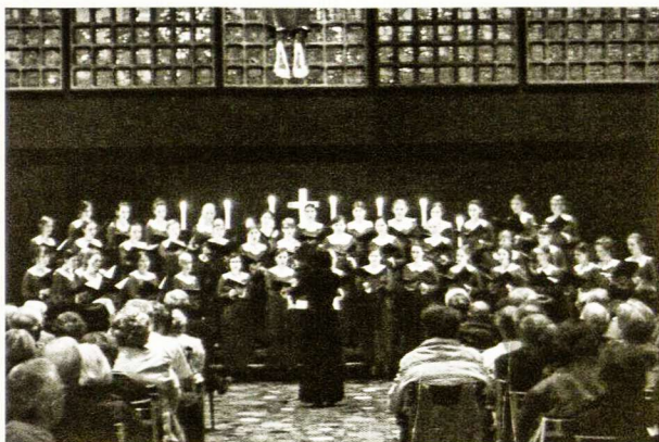
„Liepaičių“ choro koncertas Berlyne