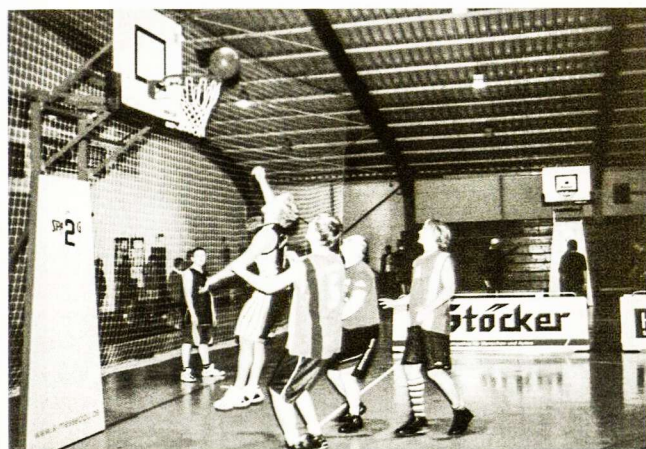
Lietuvių komandos rungtyniauja Hemsbacho krepšinio turnyre

Balandžio 12 d. vakare Hemsbache vyko tradicinis krepšinio turnyras „Krepšinio naktis“. Jame dalyvavo keturios gimnazistų