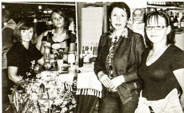
Gegužės 24 d. susitikimas