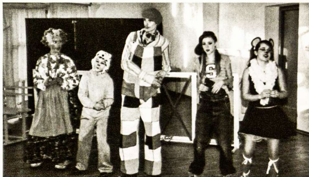
Pifas su savo šeimyna