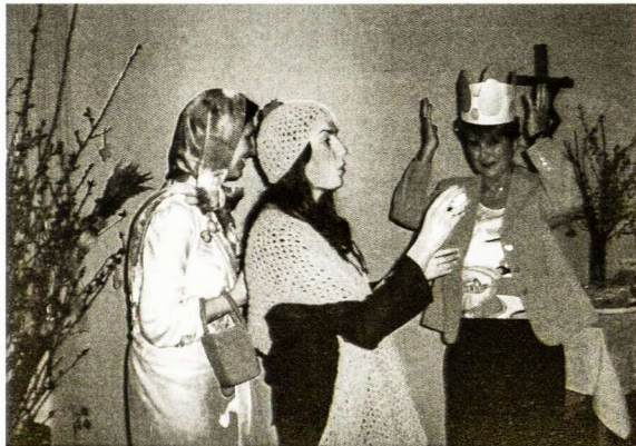
Višta karūnuoja margučių karalių