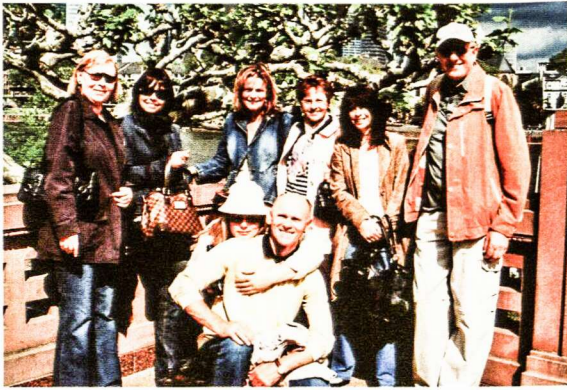
Mokytojai išskylauja.

Gegužės 17 d. organizuota mokytojų iškyla į Frankfurtą. Dalyvavo 21 mokytojas, maždaug pusė lietuvių ir pusė vokiečių. Kelios mokytojos iškylon pasiėmė ir savo vy-