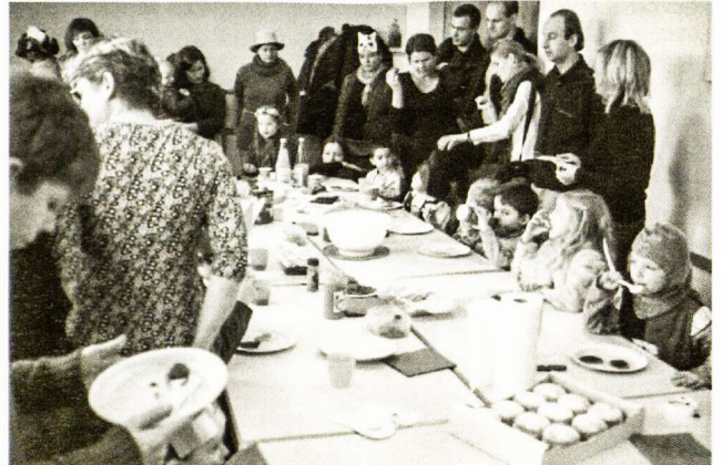
... ir prie stalo

Užgavėnių stalą vaikučiai papuošė įvairiausiais gardumynais bei tradiciniu Užgavėnių patiekalu blynais.