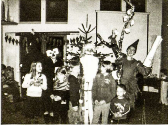
Bremeno apylinkės Kalėdos

Šių metų sausio pradžioje susibėgė į nedidelį būrelį išsirinkome Bremeno apylinkės valdybą ir Hüttenfelde užregistravome dar vieną (atsikūrusią) Vokietijos lietuvių bendruomenės atžalėlę. Maitinsime ją lietuviškomis dainomis, puoselėsime šokiais ir žaidimais. Kol kas mūsų renginių kraitelė dar labai kukli.