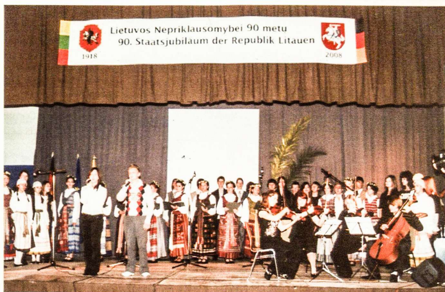
Lietuvos valstybės atkūrimo minėjimo muzikinė programa Hüttenfelde