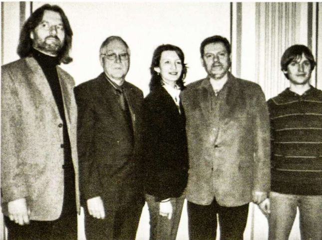
Vokietijos LB Valdyba: