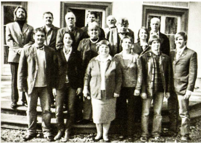
Vokietijos LB Taryba 2008–2010 m.: