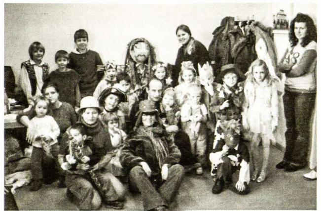
Vaikai su tėvais

Lietuviškos valandėlės metu vaikučiai darė Užgavėnių kaukes, žaidė Užgavėnių žaidimus, galynėjosi kaip Lašininis su Kanapiniu. Taip pat vyko tarp vaikučių ir Kanapinio virvės traukimo varžybos. Kas galėjo patikėti, kad vaikai tokie stiprūs ir pertrauks virvę.