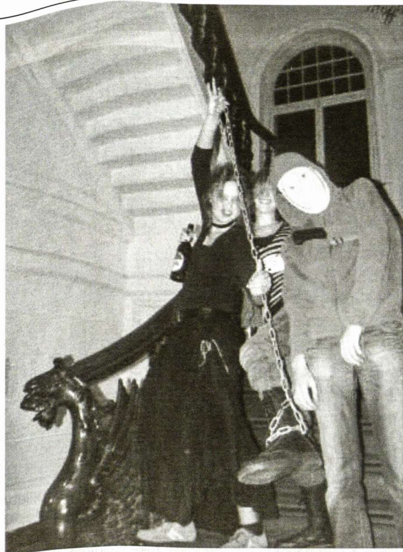
Suvažiavime Jūsų lauks ir daug netikėtumų (Nuotraukos iš pereinusių metų suvažiavimo)