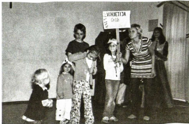
Prisistato Cellės lituanistinė mokykla * „Draugystės tiltas 2007 m.“ * (Nuotrauka Marytės Dambriūnaitės Šmitienės)