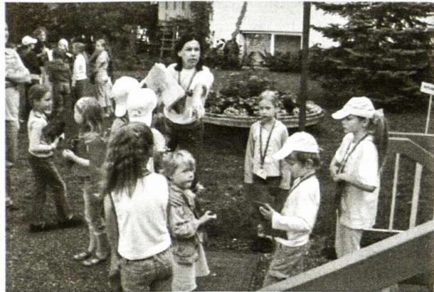
Mažieji rengiasi užsiėmimams * (Nuotrauka Info)