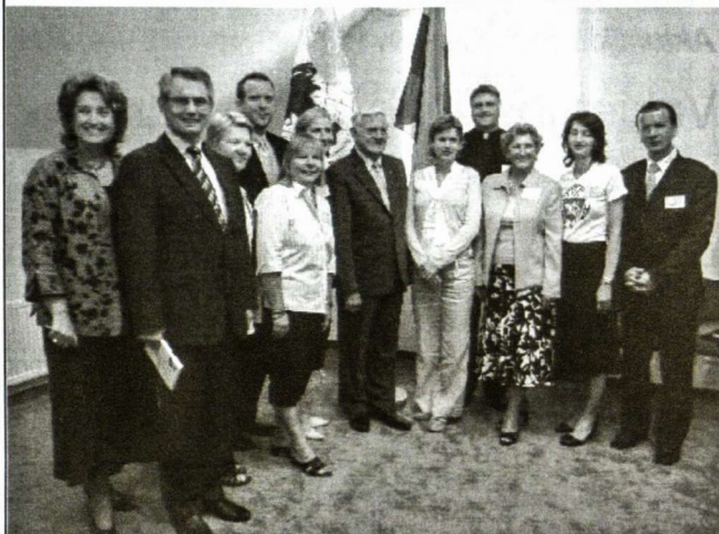
PLB Valdybos nariai su LR Prezidentu ir Seimo Pirmininku

Akivaizdu, kad ši tendencija stiprės. Tai netolimoje ateityje gali turėti ir nemažai teigiamų pasekmių Lietuvos gyvenimui, su sąlyga, kad bus išlaikytas emigravusiųjų ryšys su valstybe. Jeigu ne tiesiogiai, tai per artimuosius ir Lietuvoje likusius draugus bus „eksportuojamas“ svetur įgytas požiūris į visuomenės funkcionavimo mechanizmus, valstybės valdymą, nevyriausybinių organizacijų veiklos svarbą, moralinius principus, kurie galioja senas demokratijos tradicijas puoselėjančių valstybių viešajame gyvenime.