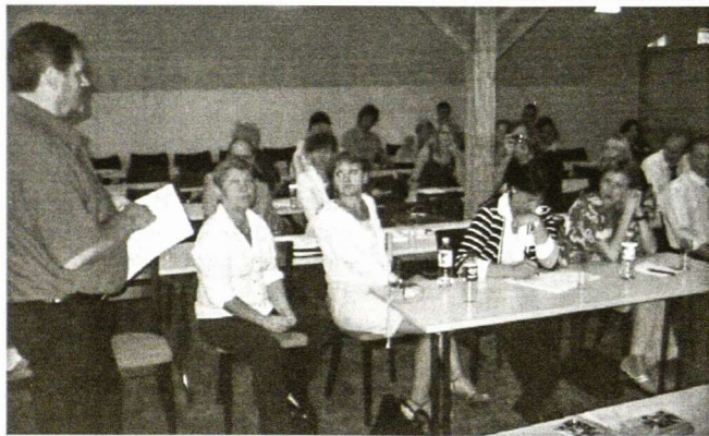
Europos kraštų Bendruomenių vadovai aptaria savo reikalus

Tačiau yra nemažai ir optimistiškai nuteikiančių pavyzdžių. Lietuvos didžiausias turtas – žmonės. Už jos ribų gyvena daug ryškių asmenybių, žmonių, kuriems lietuviybės išsaugojimas ir Lietuvos ateitis rūpi ypatingai. Nekyla abejonų, kad esant reikalui jie neliks nuošaly. Į tėvynę jau ima grįžti gerai išsilavinę ir nemažai pasaulyje matę jauni lietuviai, kuriems rūpi būtent čia įgyvendinti savo idėjas. Jų tikslas – ne perimti valdžią, bet keisti visuomenę, kuri ateity pati sugebėtų tinkamai rūpintis savo valstybe.