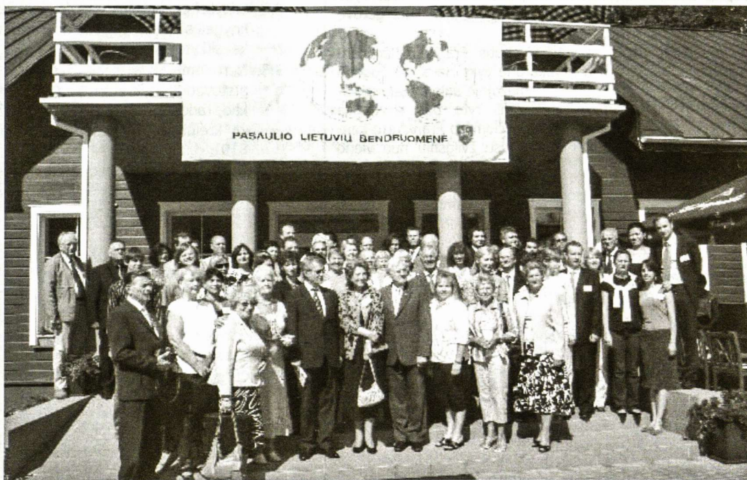
Pasaulio Lietuvių Bendruomenės pirmininkų suvažiavimo Kernavėje dalyviai su Prezidentu V. Adamkum