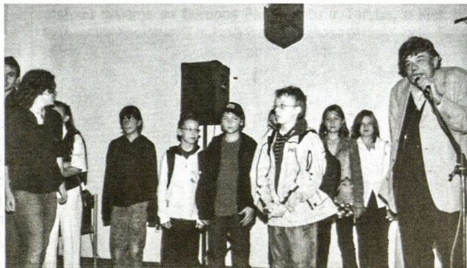
Direktorius ir abiturientai sveikina pačius jauniausius mokinius penktokus, pradėjusius mokytis gimnazijoje