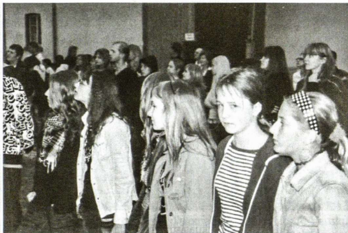
Vėliavos pakėlimui išsirikiavę mokiniai per mokslo metų atidarymą

Po to atskirų klasių mokiniai susirinko pokalbio su savo auklėtojais. Visi – mokiniai ir mokytojai – tikisi gražių ir darbinių 2007–2008 mokslo metų. I. Grevienė