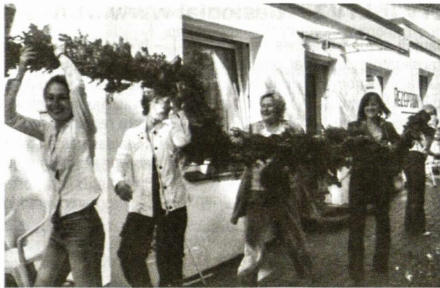
Vainikus pynėm, laužą kūrenom