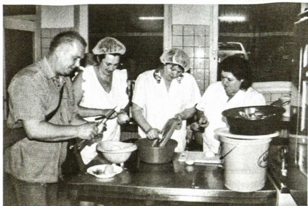
Kažin kiek bulvių gimnazijos personalui reikės šiais metais nuskusti?

1949 m. Seeligenštādo DP stovykloje pastatytas ir pašventintas lietuviškas kryžius. Jis buvo perkeltas ir šiuo metu stovi priešais Vasario 16-osios gimnazijos klasių pastatą.